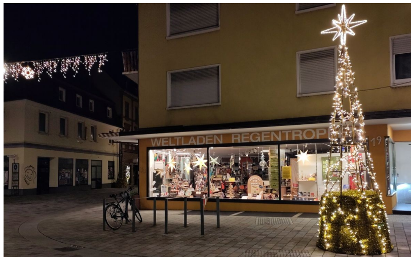
Weltladen Regentropfen am frühen Morgen ...

Wir wünschen Ihnen schöne und besinnliche Feiertage.