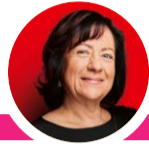
DR. BÄRBEL KOFLER PARLAMENTARISCHE STAATSEKRETÄRIN/MDB

„Als Ärztin habe ich mit Menschen in Kolkata in Indien gearbeitet, die unter menschenunwürdigen Bedingungen Jeans bestickten und Hemden und Kleider nähten. Sie konnten es sich nicht leisten, krank zu feiern, und uns blieb nur, ihre Leiden ein wenig zu lindern. Keine befriedigende Aufgabe, wenn man die Ursachen der Krankheit nicht wenigstens verringern kann. Daran kann sich nur etwas ändern, wenn ein Lieferkettengesetz zumindest Menschenrechtsverletzungen verhindert. Wir setzen uns zusammen mit dem Eine-Welt-Kreis für das Lieferkettengesetz ein – mit Unterschriftensammlungen, Veranstaltungen und Briefen an die Abgeordneten unserer Region.“