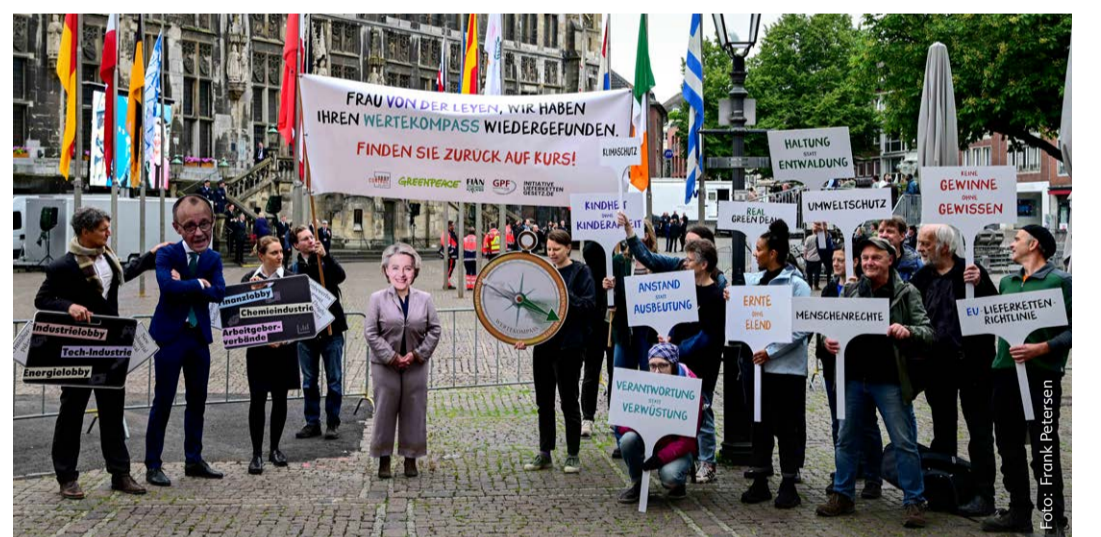
Protestaktion gegen die Abschwächung des EU-Lieferkettengesetzes in Brüssel

Die Wahlen haben zu einem krassen Rechtsruck im EU-Parlament geführt. Ursula von der Leyen wurde für eine zweite Amtszeit von der EVP (Europäische Volkspartei, der auch CDU/CSU angehören) nur unter der Bedingung vorgeschlagen, dass sie Ernst macht mit der Deregulierungsagenda der Konzerne. Die erste Richtlinie, die dieser Agenda zum Opfer fiel, war die EU-Lieferkettenrichtlinie. 2024 noch als Meilenstein für Umwelt, Klima- und Menschenrechte verabschiedet, wurde sie bis Ende 2025 massiv abgeschwächt – mithilfe einer Mehrheit aus konservativer EVP-Fraktion und den drei Rechtsaußen-Fraktionen im