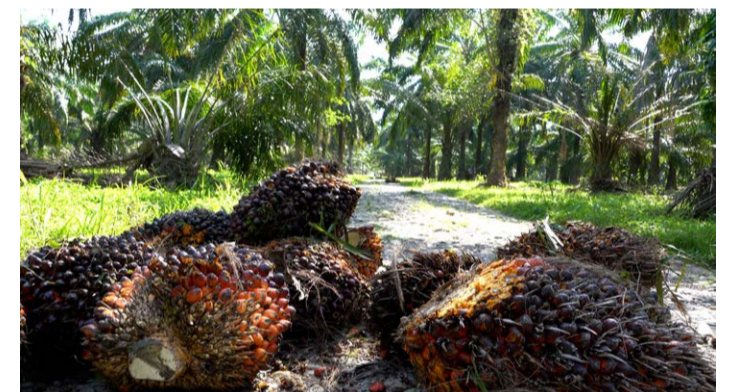
Palmölerte in Honduras

Setzt euch dafür ein, dass diese Gesetze bestehen bleiben und auch wirklich umgesetzt werden! Für uns sind Lieferkettengesetze wichtig, weil sie dazu beitragen, dass ein Unternehmen, das beispielsweise Palmöl produziert, dies unter Achtung der Rechte der Gemeinden und der Natur tun muss. Dank der internationalen Solidarität fühlen wir uns bestärkt und zutiefst ermutigt. Denn sozialer Kampf verlangt Mut – den Mut zu glauben, zu fühlen und darauf zu vertrauen, dass unser Anliegen gerecht ist. Daraus schöpfen wir Zuversicht.