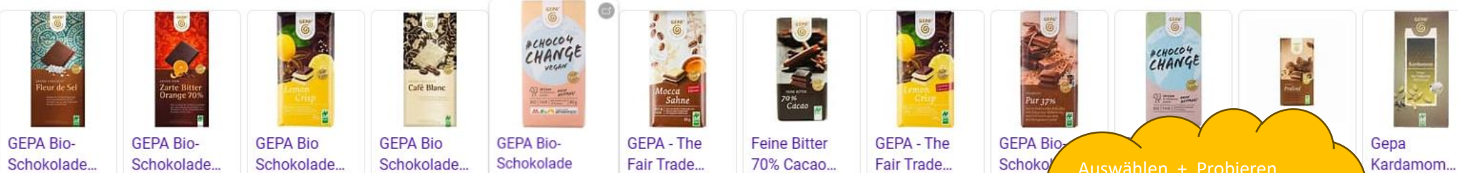
GEPA Bio-Schokolade... GEPA Bio-Schokolade... GEPA Bio-Schokolade... GEPA Bio-Schokolade... GEPA Bio-Schokolade... GEPA - The Fair Trade... Feine Bitter 70% Cacao... GEPA - The Fair Trade... GEPA Bio-Schokolade... Gepa Kardamom...